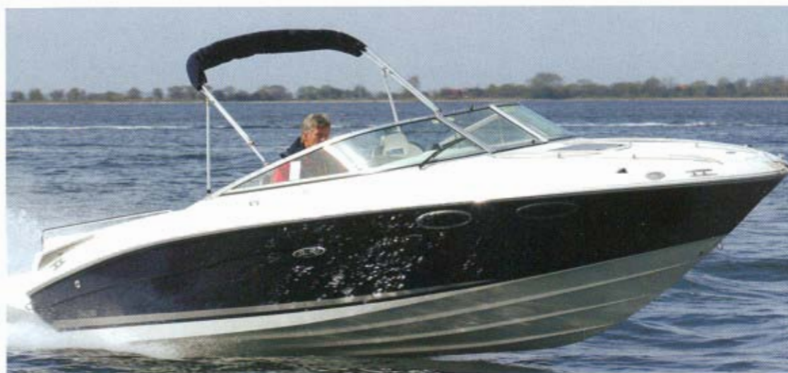
Sporty og lav i linjerne giver et elegant indtryk.