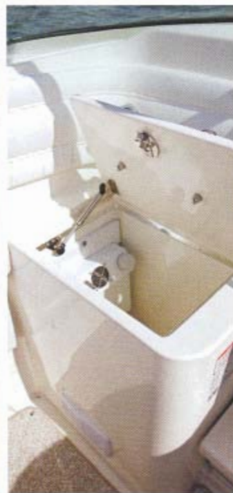
Typisk amerikansk - køleboks under agterbænken.