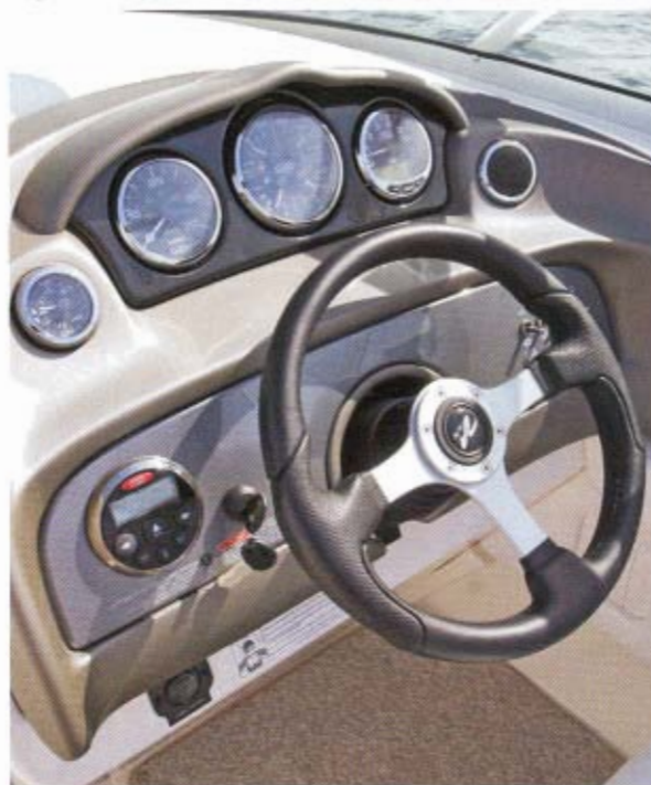
Store instrumenter, men lidt reflekser i glasset reducerer aflæsningen. Ikke plads til integreret skærm.