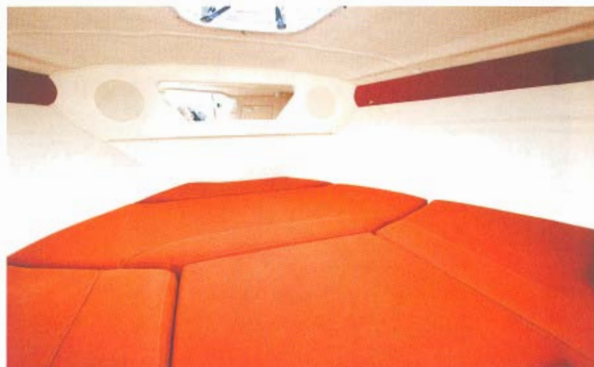
Dobbeltkøjen i kahytten har gode mål og friske farver lyser op.

► PRØVESEJLET BENGT-ERIK IVERSEN • FOTO FREDERIK FINNES • GRAFIK STAFFAN WESTERLING